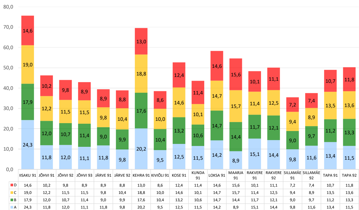
Lisa 2, p. 2 - Keskmised kohalejõudmise ajad ("korraldus" ja "kohal" märgitud aegade vahe) iga prioriteedi lõikes